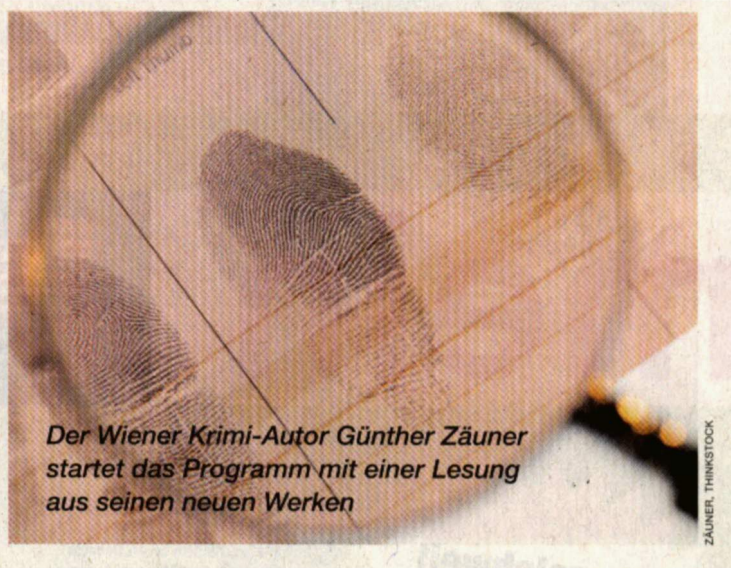
Der Wiener Krimi-Autor Günter Zäuner startet das Programm mit einer Lesung aus seinen neuen Werken